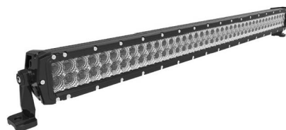
LTPRTZ® DR-SERIES 40" 240W Artikelnummer: LTPZDR240