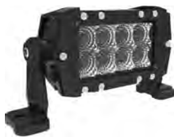
LTPRTZ® DR-SERIES 4" 24W Artikelnummer: LTPZDR24