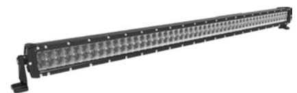
LTPRTZ® DR-SERIES 50" 300W Artikelnummer: LTPZDR300

Sie benötigen weitere Modelle, ausführliche Informationen und Preislisten - kontaktieren Sie uns!