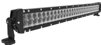
LTPRTZ® DR-SERIES 30" 180W Artikelnummer: LTPZDR180