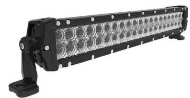
LTPRTZ® DR-SERIES 20" 120W Artikelnummer: LTPZDR120