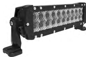
LTPRTZ® DR-SERIES 10" 60W Artikelnummer: LTPZDR60